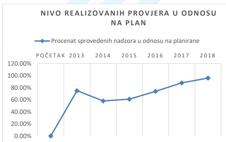
Dijagram 2 - Nivo realizovanih provjera u odnosu na plan

Na osnovu dijagramskog prikaza se može izvesti zaključak da se, iz godine u godinu, bilježi trend rasta nivoa realizacije plana. Prikazani dijagram predstavlja realizaciju plana koja se tumači i stalnim poboljšanjem mehanizma planiranja, ali i objedinjavanjem pojedinačno planiranih provjera sprovedenjem više većih. Iako nijesu sprovedene sve provjere iz Plana nadzora za 2018. godinu, konstatuje se da je sproveden dovoljan broj provjera kako bi se tokom dvogodišnjeg perioda provjerila usaglašenost pružaoca usluga sa primjenljivim sigurnosnim regulatornim zahtjevima u svim relevantnim oblastima funkcionalnog sistema, čime se ispunjava zahtjev iz člana 7 stava 3 tačke (d) Uredbe (EU) br. 1034/2011 koja je